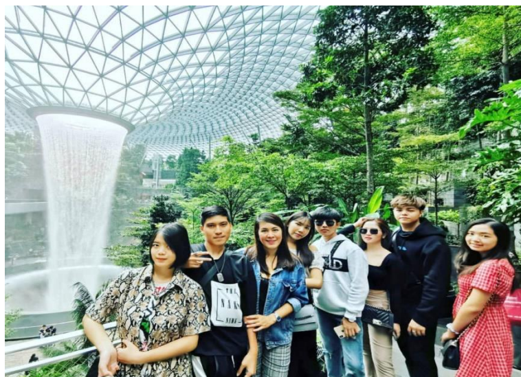
ภาพที่ 3.15 สนามบินนานาชาติชางจีของประเทศสิงคโปร์เป็นสนามบินที่ได้รับการจัดอันดับว่าดีที่สุดในโลกมีความสวยงาม และทันสมัยจึงมีนักท่องเที่ยวจำนวนมากนิยมถ่ายภาพภายในสนามบิน

3. สิ่งอำนวยความสะดวก (Amenities) องค์ประกอบในด้านสิ่งอำนวยความสะดวกด้านการท่องเที่ยวและบริการทางการท่องเที่ยวจะเป็นสิ่งที่เป็ปัจจัยสำคัญที่จะสร้างความพึงพอใจ ความประทับใจ ความสุขใจในระหว่างตลอดเส้นทางการเดินทาง สิ่งที่เกิดขึ้นเพื่อให้เอื้อประโยชน์และอำนวยความสะดวกแก่นักท่องเที่ยว เช่น ถนน ไฟฟ้า น้ำประปา ระบบโทรศัพท์ แผนที่ อินเทอร์เน็ต ป้ายบอกทาง ศูนย์ให้บริการข้อมูลทางการท่องเที่ยว เจ้าหน้าที่อำนวยความสะดวกจากรัฐ สนามบิน ระบบปัญญาประดิษฐ์ เป็นต้น