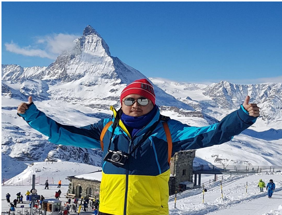
ภาพที่ 3.13 ยอดเขา Matterhorn เมือง Zermatt ประเทศสวิตเซอร์แลนด์ เป็นยอดเขาที่มีความสวยงามตามธรรมชาติดึงดูดใจนักท่องเที่ยวทั่วโลก

1.1 สิ่งดึงดูดใจที่มาจากความสวยงามตามธรรมชาติ สิ่งดึงดูดใจประเภทนี้จะเป็นพวกทรัพยากรหรือแหล่งท่องเที่ยวทางธรรมชาติที่มีนักท่องเที่ยวได้เคยเดินทางไปสัมผัสและเกิดการบอกเล่าต่อกันมา รวมถึงมีการลงสถานที่ท่องเที่ยวทางธรรมชาติเหล่านี้ผ่านสื่อต่าง ๆ ไม่ว่าจะเป็น หนังสือพิมพ์ นิตยสาร คู่มือการท่องเที่ยว การเล่าถึงประสบการณ์ผ่านสื่อออนไลน์ต่าง ๆ ทำให้แหล่งท่องเที่ยวทางธรรมชาติเหล่านี้สามารถดึงดูดใจให้นักท่องเที่ยวที่ยังไม่เคยเดินทางไปต้องการที่จะลองไปสักครั้ง และรวมถึงผู้ที่เคยเดินทางไปแล้วก็ยังสามารถเดินทางไปซ้ำอีกหลาย ๆ รอบจากความประทับใจในความงามธรรมชาติ ดังตัวอย่างเช่น แม่น้ำลำคลอง ป่าไม้ภูเขา ถ้ำ น้ำตก น้ำพุร้อน ทะเลสาบ หน้าผา ภูเขา น้ำแข็ง ภูเขาหิมะ ธารน้ำแข็ง ชายหาด ทะเล มหาสมุทร เกาะ