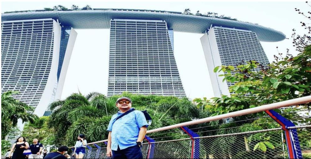
ภาพที่ 3.15 โรงแรมมารินา เป็นโรงแรมที่มีความหรูหรา และสวยงามเป็นสิ่งดึงดูดใจที่มาจากโรงแรมที่มีต่อนักท่องเที่ยวที่เดินทางไปสิงคโปร์