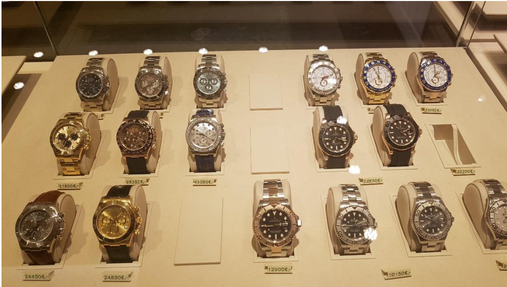
ภาพที่ 3.15 นาฬิกา Rolex เป็นสิ่งดึงดูดใจให้นักท่องเที่ยวประเภทของของที่ระลึกที่นักท่องเที่ยวจำนวนมากที่เดินทางไปประเทศสวิตเซอร์แลนด์เลือกซื้อ