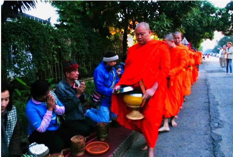
ภาพที่ 3.14 ประเพณีการตักบาตรข้าวเหนียวที่หลวงพระบางเป็นสิ่งดึงดูดใจนักท่องเที่ยวที่มาจากวิถีชีวิตชุมชน และวัฒนธรรม

เดินทางไปยังสถานที่ท่องเที่ยวต่าง ๆ เพื่อที่จะต้องการศึกษาถึงประวัติความเป็นมา ความสำคัญ ความเก่าแก่ และเรื่องราวของโบราณสถาน และโบราณวัตถุเหล่านั้น โบราณสถานโบราณวัตถุ และประวัติศาสตร์จึงเป็นสิ่งดึงดูดใจทางการท่องเที่ยวและบริการที่ดีมากอย่างหนึ่ง ดังตัวอย่างเช่น วัดพระแก้ว พระพระศรีสรรเพชญ์ อุทยานประวัติศาสตร์สุโขทัย อุทยานประวัติศาสตร์ศรีสัชนาลัย วัดพระสิงค์ สะพานข้ามแม่น้ำแคว พิพิธภัณฑสถานแห่งชาติ เจดียซ์เวดากอง นครวัด สุสานจีนชื่อยองเต้ พระราชวังแวร์ซาย พิพิธภัณฑลุ่มพัวร์ พิพิธภัณฑแวนโก๊ะ เป็นต้น