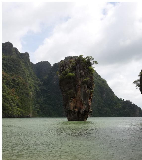
ภาพที่ 3.2 เขาตาปูสิ่งดึงดูดใจจากทัศนียภาพที่สวยงามตามธรรมชาติที่มีชื่อเสียงระดับโลกของจังหวัดพังงา

1.1 สิ่งดึงดูดใจจากทัศนียภาพที่สวยงามตามธรรมชาติหรือทิวทัศน์ที่มาจากธรรมชาติที่มีการถ่ายทอดไปตามสื่อต่าง หรือการบอกต่อจากประสบการณ์นักท่องเที่ยวทำให้นักท่องเที่ยวเกิดความตื่นตัวสนใจจากสิ่งดึงดูดใจทางธรรมชาติเหล่านั้น เช่น ป่าไม้ภูเขาแม่น้ำ ลำคลอง ทะเล น้ำตก หน้าผา บ่อน้ำ น้ำพุร้อน เกาะแก่ง อุทยาน ทะเลสาบ ถ้ำ ชายหาด แหลม เป็นต้น