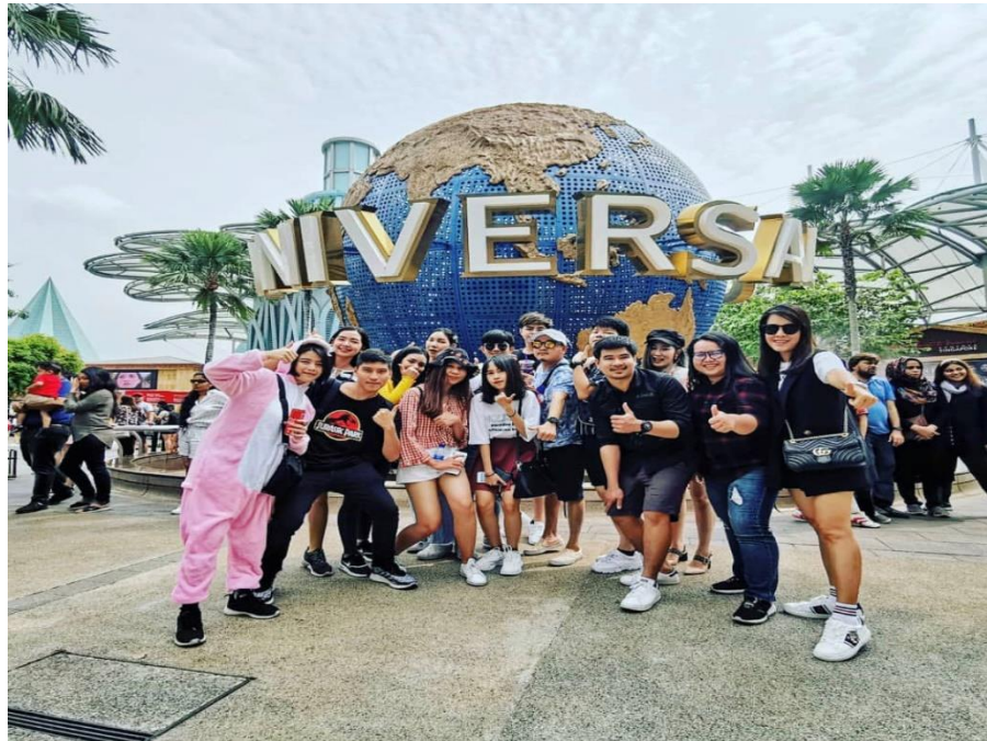
ภาพที่ 3.14 สวนสนุก universal studio เป็นสวนสนุกระดับโลกที่เป็นสิ่งดึงดูดใจที่มาจากสถานที่พักผ่อนหย่อนใจ และกิจกรรมนันทนาการทางการท่องเที่ยว

นักท่องเที่ยวสามารถเข้าร่วมกิจกรรมนันทนาการเพื่อสร้างความบันเทิงต่าง ๆ ให้กับนักท่องเที่ยวได้รับการพักผ่อนหย่อนใจเต็มที่กับแหล่งท่องเที่ยว และกิจกรรมเหล่านั้น ดังตัวอย่างเช่น กิจกรรมนวดสปา กิจกรรมปั่นผ้า กิจกรรมการเล่นคาสีโน การพายเรือคายัก สวนสนุกดิสนีย์แลนด์ สวนสนุกยูนิเวอร์แซลสตูดิโอ เป็นต้น