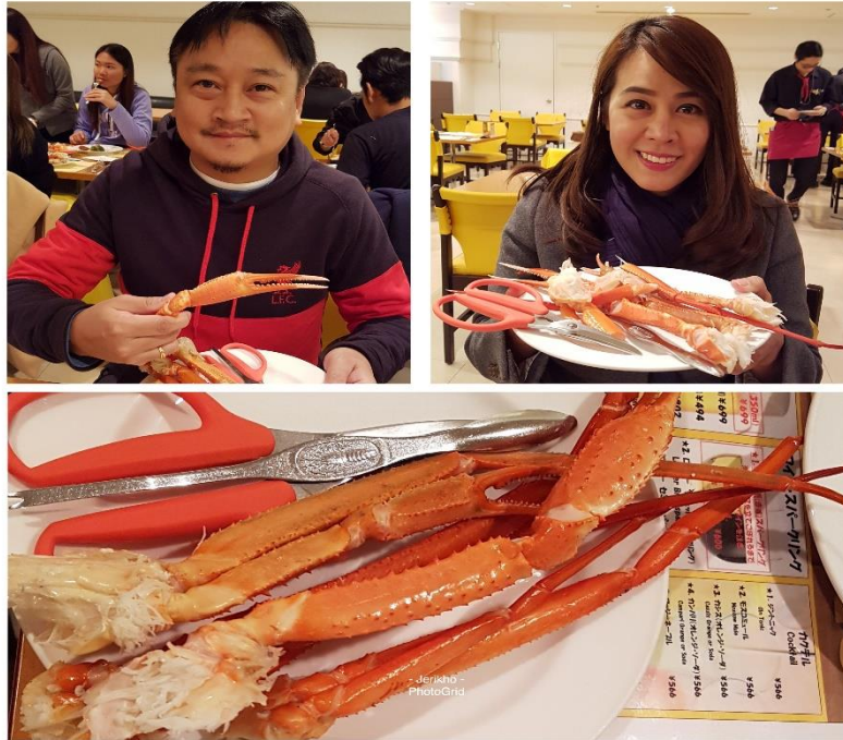
ภาพที่ 3.15 ขาปูทาราบะสิ่งดึงดูดใจที่มาจากอาหารและมีนักท่องเที่ยวจำนวนมากต้องหารับประทานเมื่อไปประเทศญี่ปุ่น