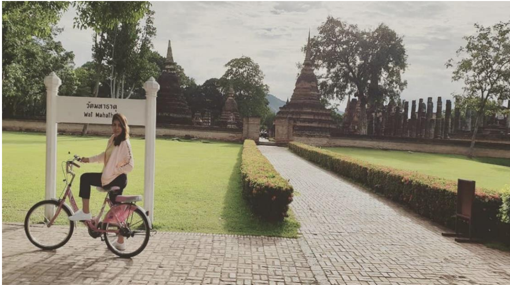
ภาพที่ 3.3 อุทยานประวัติศาสตร์สุโขทัยสิ่งดึงดูดใจจากคุณค่าทางวัฒนธรรม

วัฒนธรรมในประเทศของตน เช่น มีสิ่งที่น่าสนใจทางด้านประวัติศาสตร์หรือมรดกทางประวัติศาสตร์ที่ยังหลงเหลืออยู่ในทางโบราณคดี อนุสาวรีย์ พิพิธภัณฑสถานแห่งชาติ สถาบันทางการเมือง สถาบันทางการศึกษา วัดวาอาราม ศาสนสถาน กำแพงเมืองอนุสรณ์สถาน ชุมชนโบราณ เป็นต้น