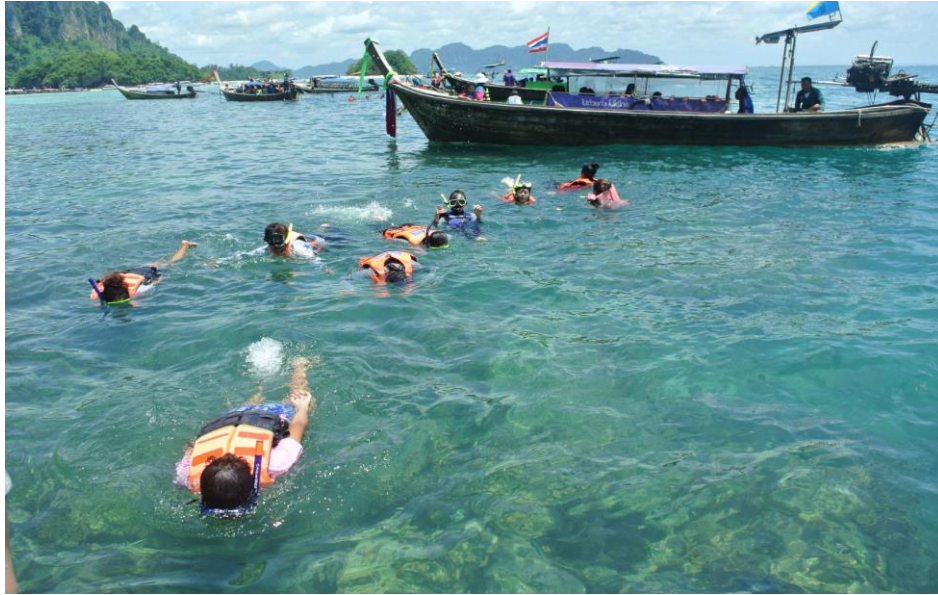
ภาพที่ 3.11 การดำน้ำดูปะการังที่เกาะพีพี จังหวัดกระบี่เป็นกิจกรรมการท่องเที่ยวทางธรรมชาติ